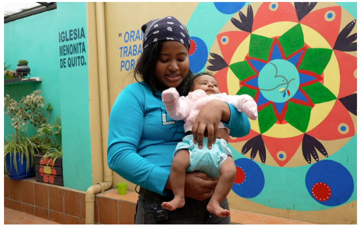
Une mère et sa fille à l'Église mennonite de Quito, en Équateur

Pour en savoir plus, rendez-vous sur le site de la Conférence mennonite mondiale ( www.mwc-cmm.org ) et recherchez « Équateur ». Consultez également l'entrée « Équateur » dans la Global Anabaptist Encyclopedia Online ( www.gameo.org ).