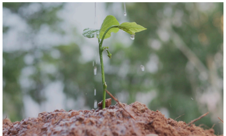
The Creation Care Task Force encourages Mennonites around the world to care for God's beautiful world

Le groupe de travail est composé de représentants de diverses régions du monde, qui apportent leur expertise et leur expérience dans les domaines des sciences, de la gestion environnementale, des ministères de la justice et du développement, ainsi que de la théologie.