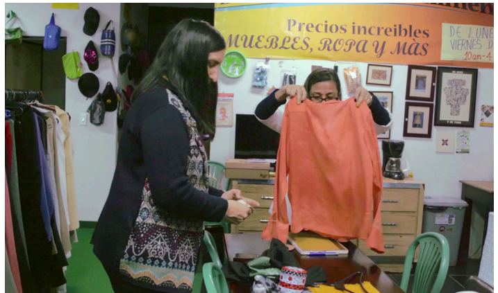
Pour réduire les déchets, une congrégation mennonite de Bogotá, en Colombie, collecte et vend des objets d'occasion.

Pour en savoir plus, rendez-vous sur le site de la Conférence Mennonite Mondiale ( www.mwc-cmm.org ) et recherchez « Colombie ». Consultez également l'entrée « Colombie » dans la Global Anabaptist Encyclopedia Online ( www.gameo.org ).