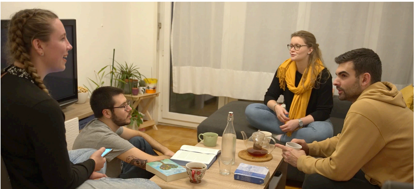
Des jeunes en Suisse discutent de la manière de prendre soin de la création de Dieu.