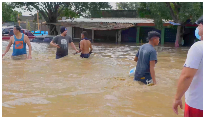
Au Honduras, les mennonites viennent en aide à leurs voisins en cas d'inondations

Un autre défi est la déforestation, qui entraîne à la fois la sécheresse et l'érosion des sols. La région est également exposée à de puissantes tempêtes et à des ouragans, et par conséquent à des inondations. De plus, la pollution de l'eau et le manque d'eau potable ont entraîné des maladies, en particulier parmi les populations les plus pauvres.