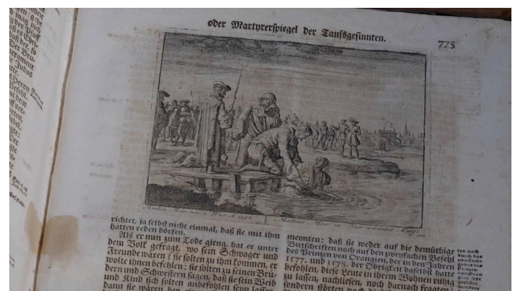
Una página de Martyrs Mirror