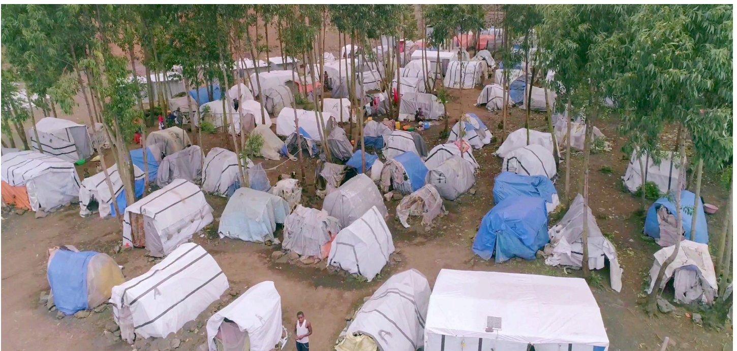
República Democrática del Congo