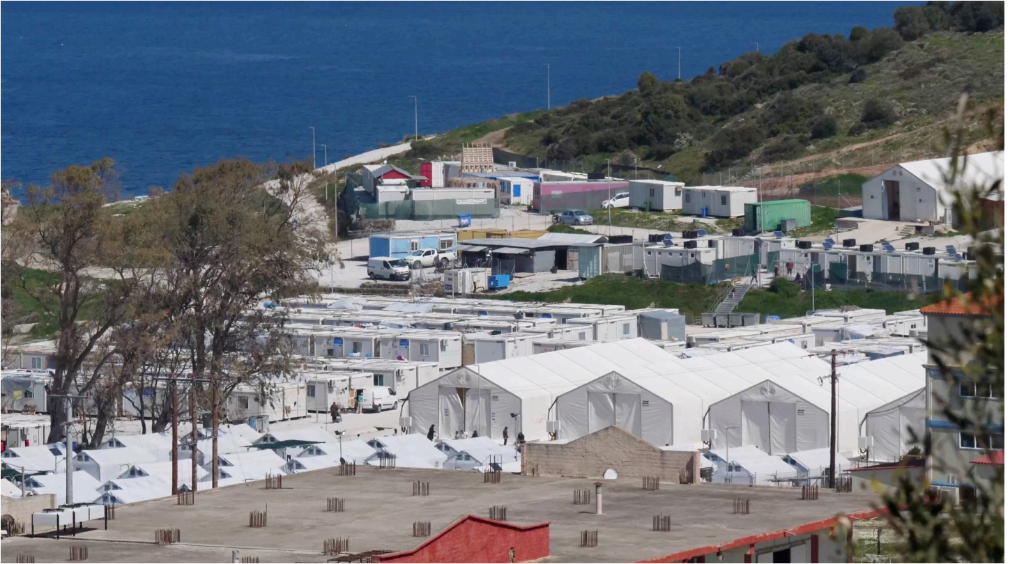
Campamento Mavrovouni, Grecia

Transmisión es una serie de cinco producciones de vídeo que culminarán en el año 2025, cuando se cumplirá el quinto centenario del movimiento anabautista.