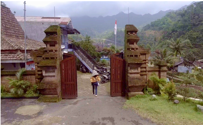
In den Bergen von Tempur

Heute besteht die GITJ-Synode aus 123 Gemeinden, wobei sich einige weitere Gemeinden in Gründung befinden, und hat etwa 45 000 getaufte Mitgliedern. Die Gemeinden befinden sich hauptsächlich entlang der Küste im Norden und Zentrum Javas, einige wenige in den Städten Semarang, Salatiga und Yogyakarta.