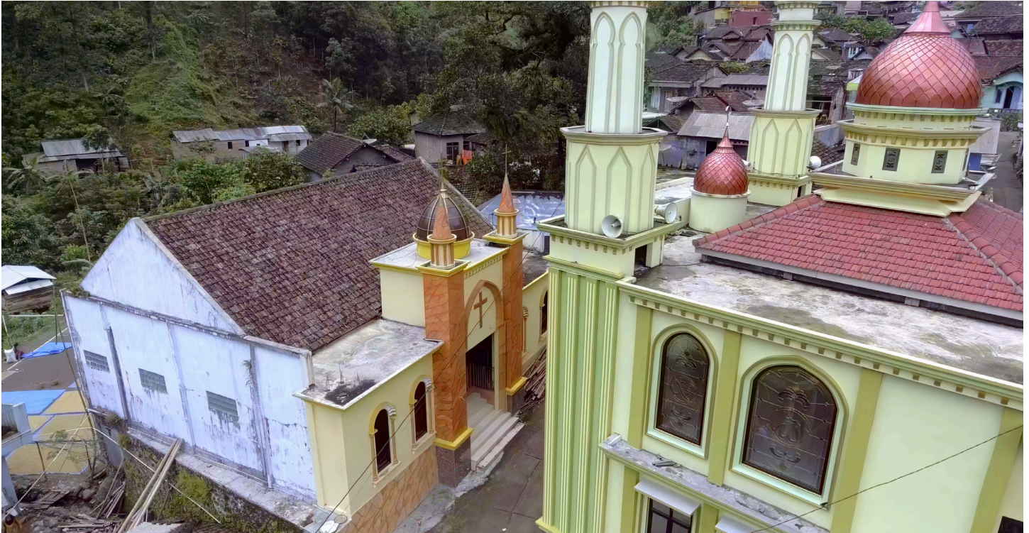
Mennonitische Kirche und Moschee gegenüber

Die Übertragung ist eine Reihe von fünf Videoproduktionen, die bis zum Jahr 2025 und dem 500-jährigen Jubiläum der Täuferbewegung führen.