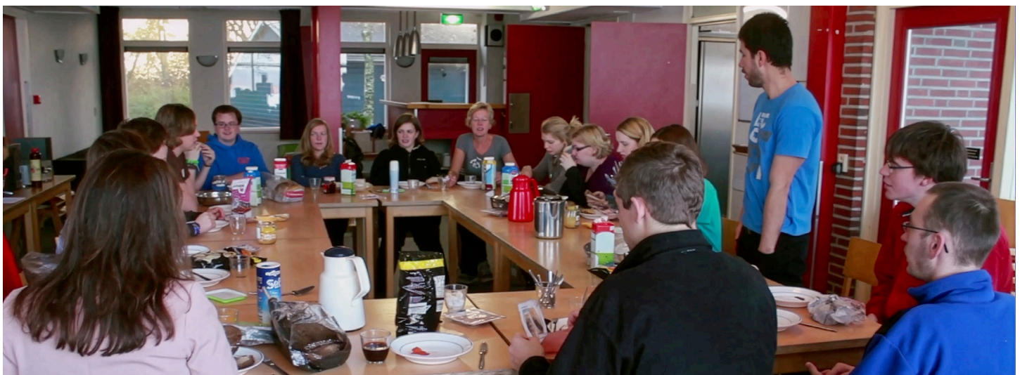
Eine Gruppe niederländischer Täufer

Weitere Informationen über die Täufer in den Niederlanden finden Sie in der Global Anabaptist Mennonite Encyclopedia Online: https:// gameo.org/index.php?title=Netherlands .