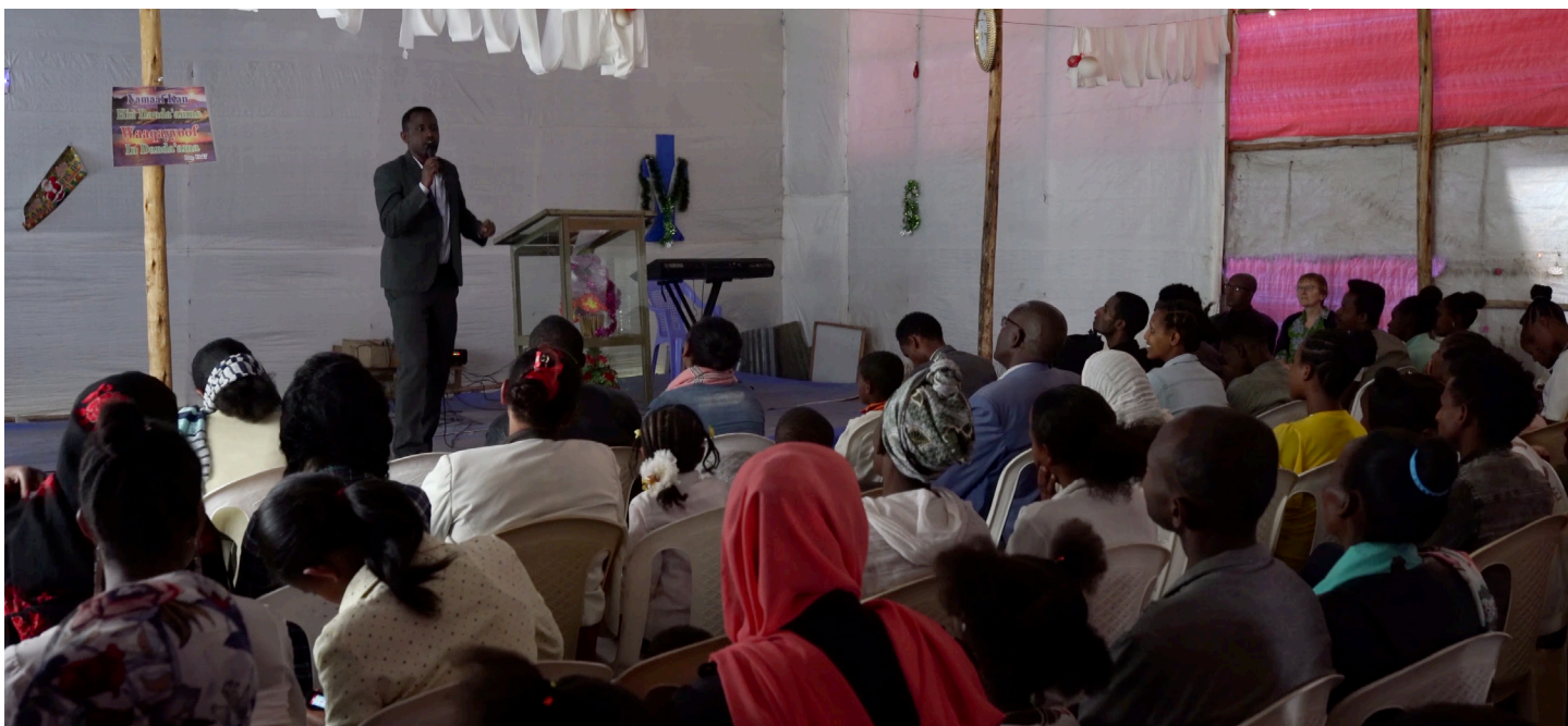
Kirche in Nazareth