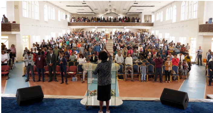
Ein Gottesdienst in Addis Abeba

Gläubige und Leiter werden ermutigt, sich auf die Führung des Heiligen Geistes zu verlassen. Im Missionsfeld öffnen vom Geist geleitete Handlungen – wie das Beten für Kranke – oft die Herzen für das Evangelium. Während MKC spektakuläre Wunderereignisse vermeidet, begrüsst es Gottes Bestätigung des Evangeliums durch veränderte Leben.