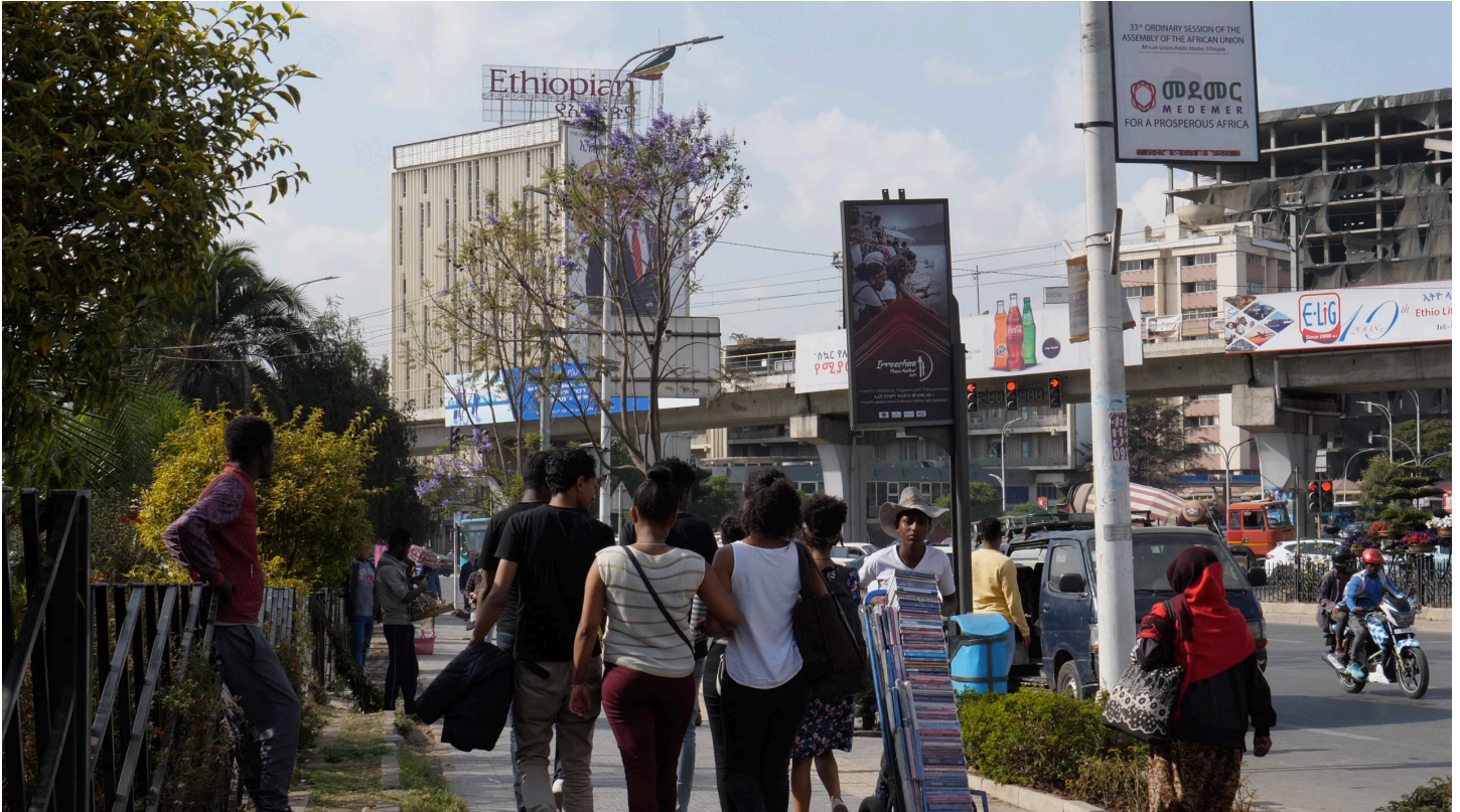
Stadt Addis Ababa

Transmission ist eine Serie von fünf Videoproduktionen, die auf das Jahr 2025 und das 500-jährige Jubiläum der Täuferbewegung vorbereitet haben und weiter inspirieren können.