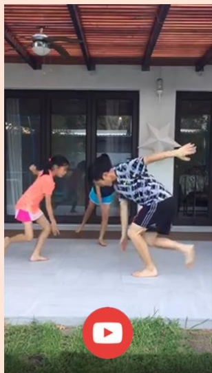
Cinco Pasos de family.fit

Encuentre todos los vídeos de family.fit en el canal family.fit YouTube®