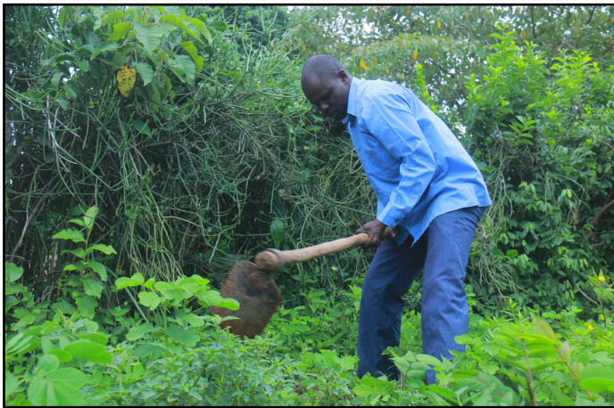
Les participants ont planté un arbre lors de la réunion du Conseil Général au Kenya en 2018. Son persévérance rappelle à l'assemblée locale la famille mondiale.