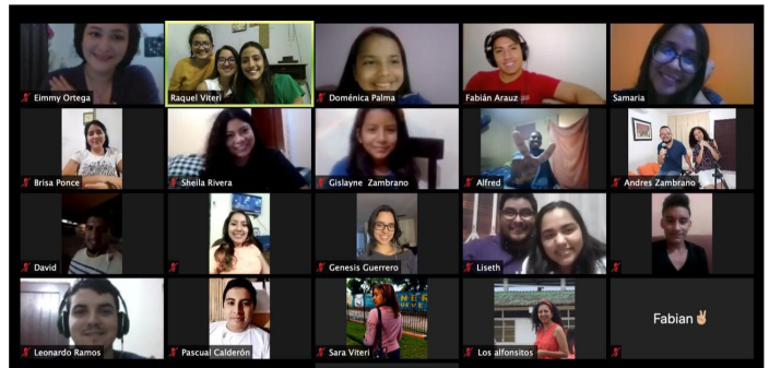
En 2020, le Consejo Juvenil Menonita d'Équateur a célébré la semaine de la Fraternité mondiale des YABs par une rencontre sur Zoom.

Si vous voulez que nous prions pour votre région durant la semaine de la fraternité YABs, veuillez envoyer vos sujets d'intercession et de reconnaissance sur Facebook en utilisant le hashtag #yabsprayer.