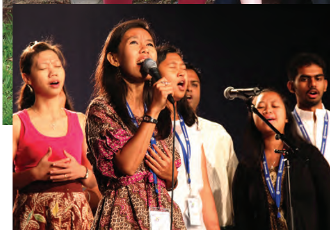
Viering op de GYS 2015.