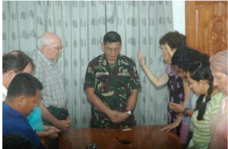
Une délégation de paix mennonite prie avec un général philippin.

Ironiquement, ce général était diplômé d'un institut de paix mennonite où il apprit qu'il existait une variété plus grande de possibilités, et donc il se mit à chercher une alternative moins violente.