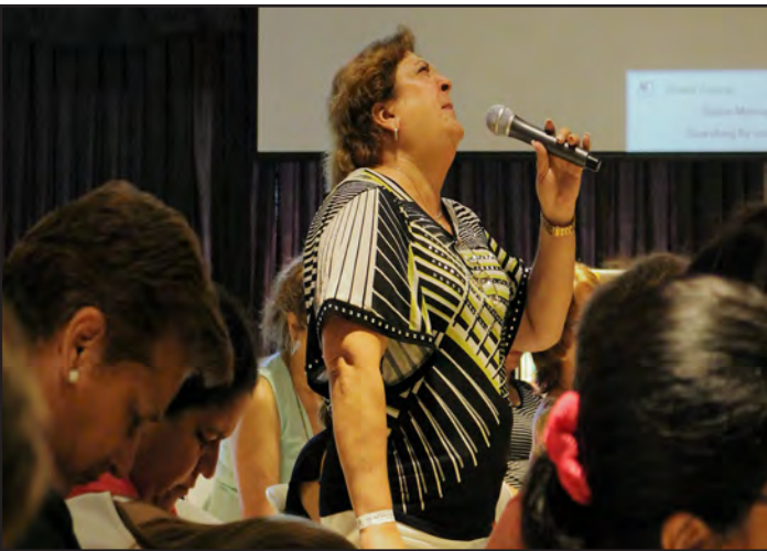
Een gebedsmoment bij de bijeenkomst van de Cono Sur (Zuidelijk Hoorn), de doperse gemeenten in Zuid-Amerika.