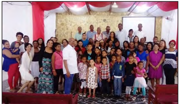
Leden van de Conferencia Evangélica Mennonita, Inc. in de Dominicaanse Republiek doen groeten aan de MWC toekomen.

*'Een Lampedusa is een kruis gemaakt uit het hout van vluchtelingenboten die aan land gespoeld zijn op een Italiaans eiland in de Middellandse Zee, voor het eerst door Francesco Tuccio gemaakt als blijk van solidariteit voor de vluchtelingen die Eritrea en Somalië ontvluchtten; hij gaf ze aan overlevenden als een symbool van hoop.' ( https://cafod.org.uk/News/International-news/Lampedusa-crosses-refugees ).