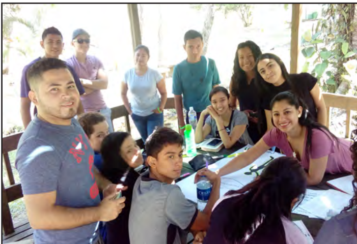
Jonge dopers nemen deel aan een workshop tijdens de JUAMCA 2017 (Juventud Anabautista Menonita Centro Americana-Conferentie van jonge mennonieten in Centraal Amerika).