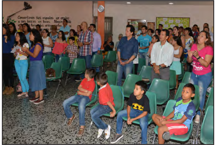
Viering van Wereldbroederschapsdag 2018 in Ibagué Mennonite church, Colombia.

Allen: Vergeef ons, Heer, als wij niet aan de kant van uw gerechtigheid en waarheid hebben gestaan bij de balling en de verworpene.