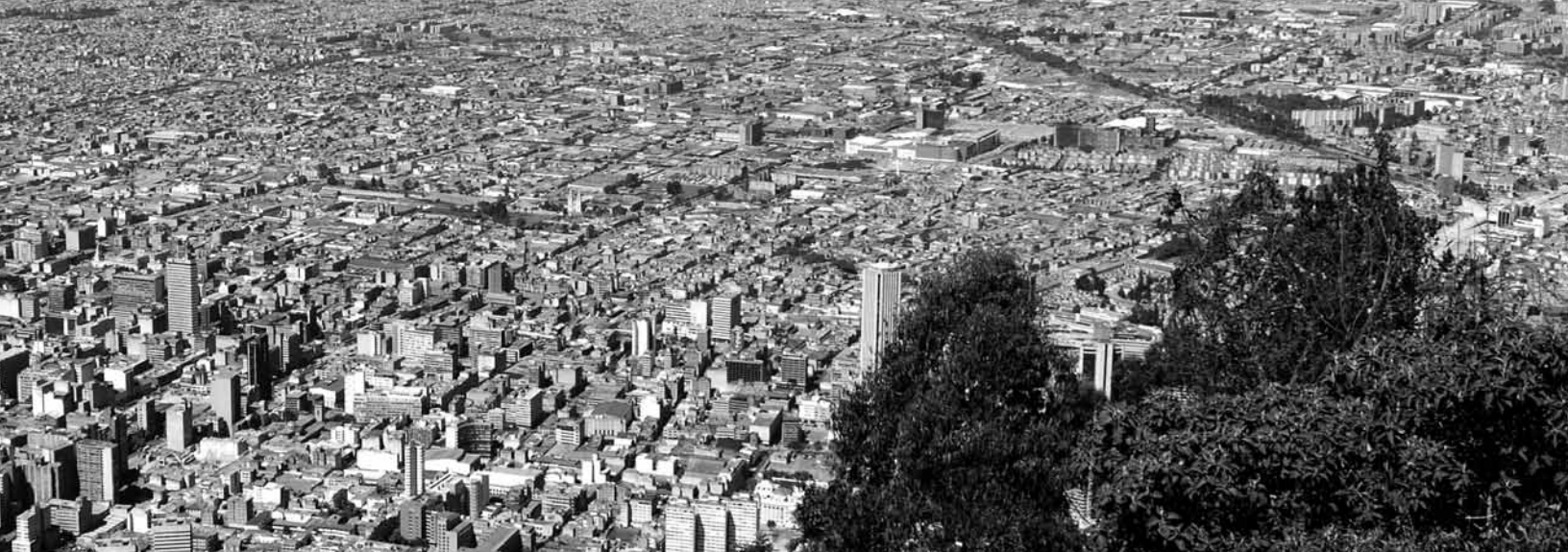
Bogotá, capital de Colombia y sede de la nueva oficina central del CMM, alberga tres iglesias miembros del CMM (páginas 6-7).

CMM y su gran deseo de ser una familia que comparte sus alegrías y sus penas”.