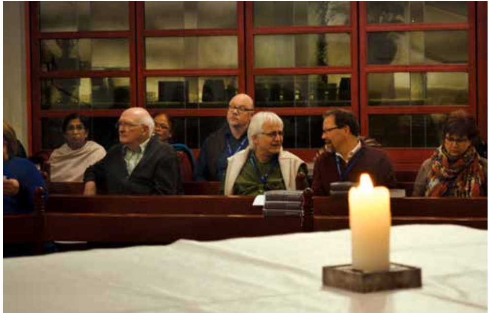
Méditation de l'Écriture lors de la rencontre des Commissions de la CMM en Allemagne en février 2017.

Devant toutes ces perspectives, l'idéal anabaptiste d'une interprétation communautaire présente une grande pertinence pour l'avenir. Elle considère que c'est l'église locale qui est l'agent herméneutique premier, ce qui contribue