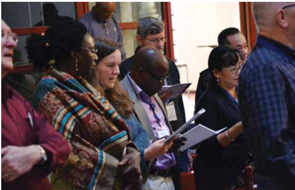
Des mennonites du monde entier célèbrent la puissance transformatrice de la Parole lors de la première rencontre de 'Renouveau 2027' à Augsburg (Allemagne), en février 2017.

Les anciens ennemis – les Églises qui ont persécuté les premiers anabaptistes – sont