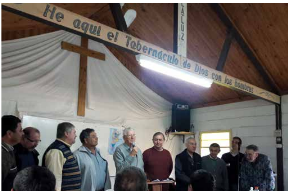
La session des pasteurs mennonites argentins s'est retrouvée à La Esperanza dans la maison de campagne de Bragado du 19 au 21 septembre 2017.