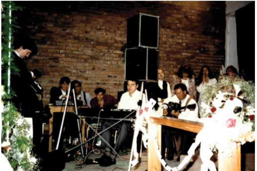
Une réunion d'église à Moron en 1996.

Sources : Statistiques mondiales du Répertoire 2015